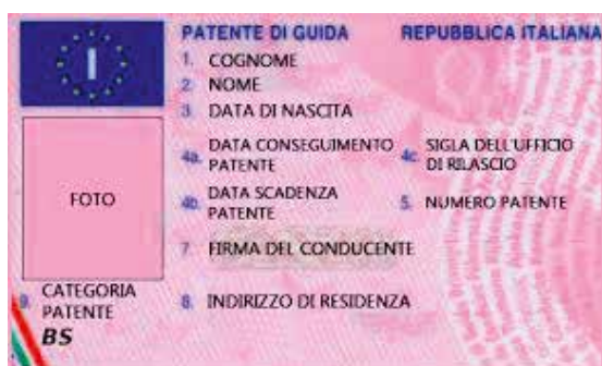
Patente B Speciale

no dal nostro problema di disabilità. A titolo informativo: per le persone „nuove patentati B speciali”, la documentazione necessaria per accedere al servizio Telepass Family e per ritirare il telepass gratuito , rivolgersi al PUNTO BLU dell'Autostrada del Brennero A 22 a TRENTO in Via Innsbruck, zona Interporto a Trento nord - telefono 0461-212729, con la seguente documentazione: